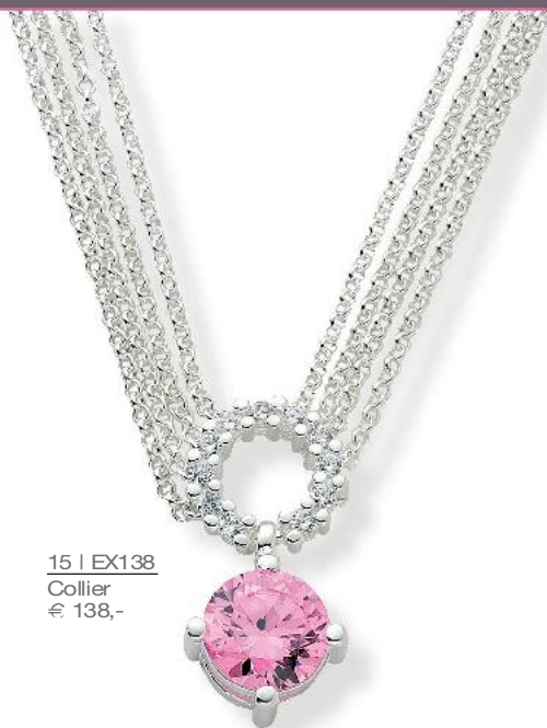
15 | EX138 Collier € 138,-