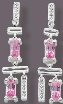
Stecker € 120,-