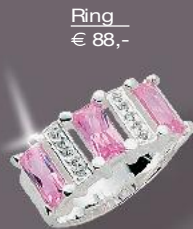
Ring € 88,-