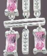
Hänger € 120,-