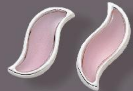
Stecker € 85,-