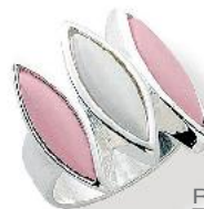
Ring € 90,-