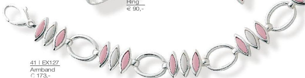
41 | EX127 Amband C 173,-