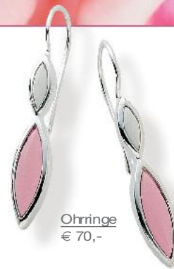
Ohringe € 70,-