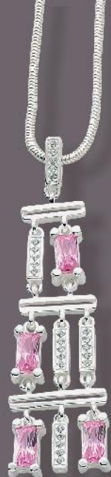
Kette € 28,-