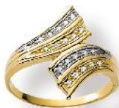
52/1913 Zirkonia € 173,-