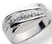
52/1914 Zirkonia € 223,-